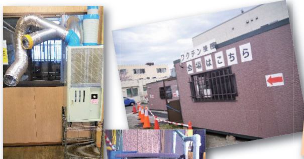
換気装置付冷房機